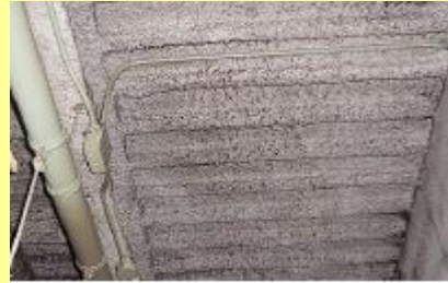
（柱・梁・天井などに吹付けられたアスベストの例）