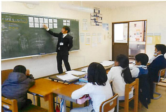
「かけはし」授業風景