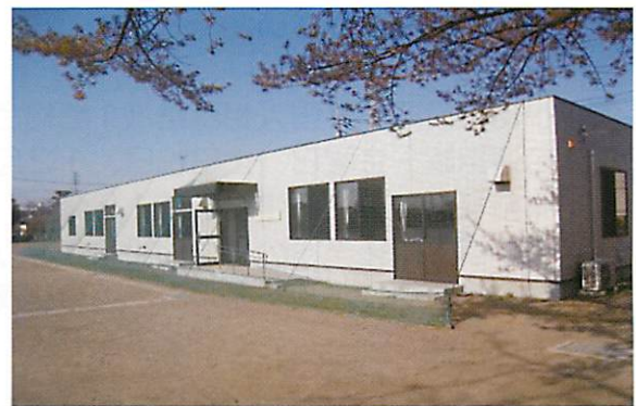
小山市外国人児童生徒適応指導教室「かけはし」

開設以来8年間で、15カ国、195人の子どもたちがここで学び、育っていきました。