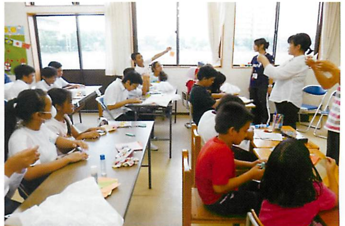
おりがみ教室の様子